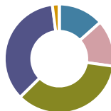
Tabel 3: Samenstelling