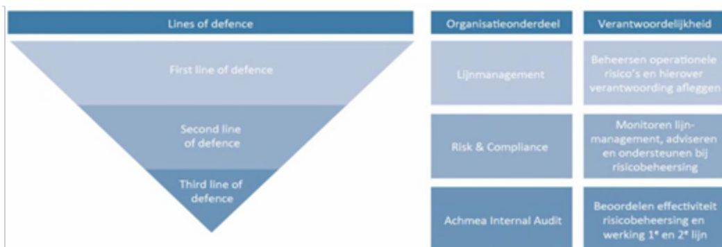
Figuur 12.1: Three Lines of Defence-model

De eerste verdedigingslinie betreft de lijnorganisatie die primair verantwoordelijk is voor het risicomanagement. Deze omvat de directie, lijnmanagement en medewerkers van Achmea IM. De directie is verantwoordelijk voor alle risicomanagement activiteiten, waarbij het lijnmanagement verantwoordelijk is voor de dagelijkse uitvoering van het risicomanagement en het waarborgen