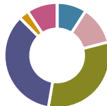
Tabel 3: Samenstelling