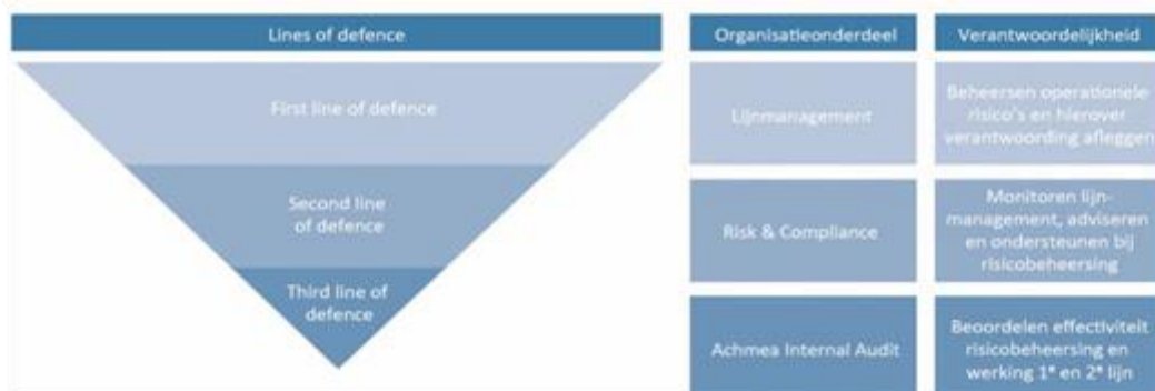
Figuur 12.1: Three Lines of Defence-model

De eerste verdedigingslinie betreft de lijnorganisatie die primair verantwoordelijk is voor het risicomanagement. Deze omvat de directie, lijnmanagement en medewerkers van Achmea IM. De directie is verantwoordelijk voor alle risicomanagement activiteiten, waarbij het lijnmanagement verantwoordelijk is voor de dagelijkse uitvoering van het risicomanagement en het waarborgen