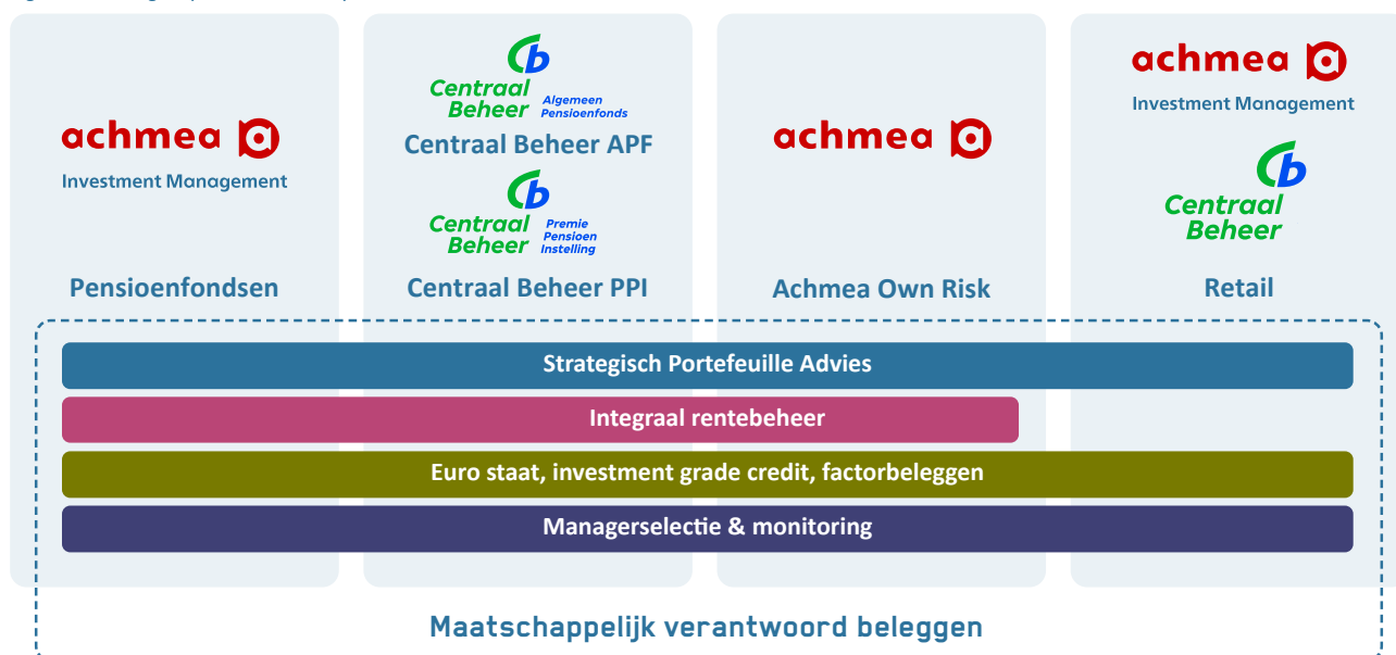
Figuur 1: Klantgroepen en kerncompetenties